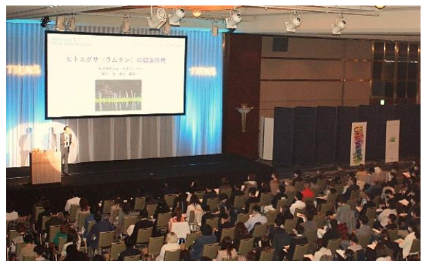
ラムナンについての講義