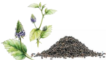
バクチオール (整肌成分)