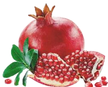
ザクロ種子オイル (整肌成分)