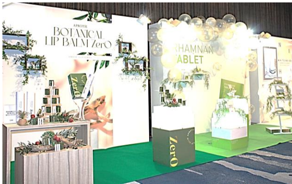
新製品展示ブース

TIENS JAPANは皆様に製品を安心して使っていただくために、品質へのこだわりと環境対策に向けたSDGsなど企業の社会的責任への取り組みを継続し、MADE IN JAPANのクオリティを維持してまいります。