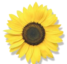
ひまわり種子油 (保湿成分)