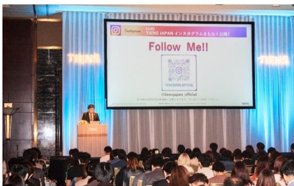
小倉副社長より挨拶。TIENS JAPAN SNS オフィシャルアカウント開設を発表